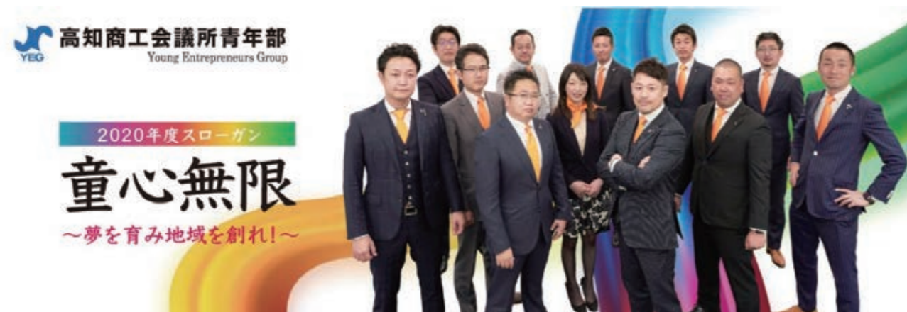
令和2年度高知YEGのHPがリニューアルいたしました。 ※写真は令和2年度高知YEGの執行部メンバーとなります。