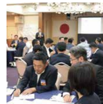
毎月の定例研修会の風景

毎月行われる定例研修会では企業経営に関連する研修会も定期的に行っています。地域の経済発展の支えとなるように、YEG活動を行う上での基礎となる企業経営のベースアップを図ります。