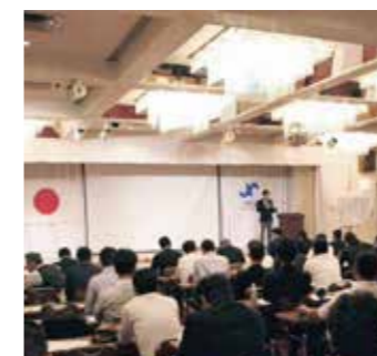
毎月の定例研修会の風景