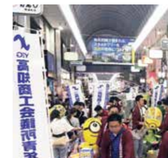
土曜夜市出店(高知市帯屋町アーケード)

YEG全体での活動、配属される委員会での活動を行うために、入念な準備を行います。多くの時間をともに活動することで相互研鑽を積み、信頼関係を築きます。そういった仲間を通じて得られるネットワークや情報は、業務への関係にかかわらず、貴重な財産となります。